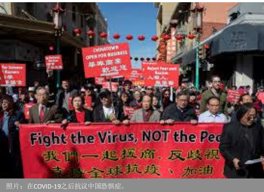
照片：在COVID-19之后抗议中国恐惧症。

随着11月大选的来临，奥巴马总统签署的《平价医疗法案》仍是最具争议的话题之一。但是事实表明，亚裔已经利用了这一政策的福利。英联邦基金会的一份报告显示 [5] ，自法案通过以来，亚裔与白人之间在医疗保健方面的差距已经缩小。因此，不足为奇的是，2016年《全国亚裔美国人调查》显示，所有亚裔群体的大多数人都表示支持《平价医疗法案》，国会和奥巴马总统于2010年签署的医疗保健法案。 [6]